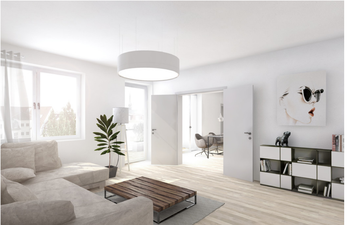
Ansicht Wohnungstyp 5