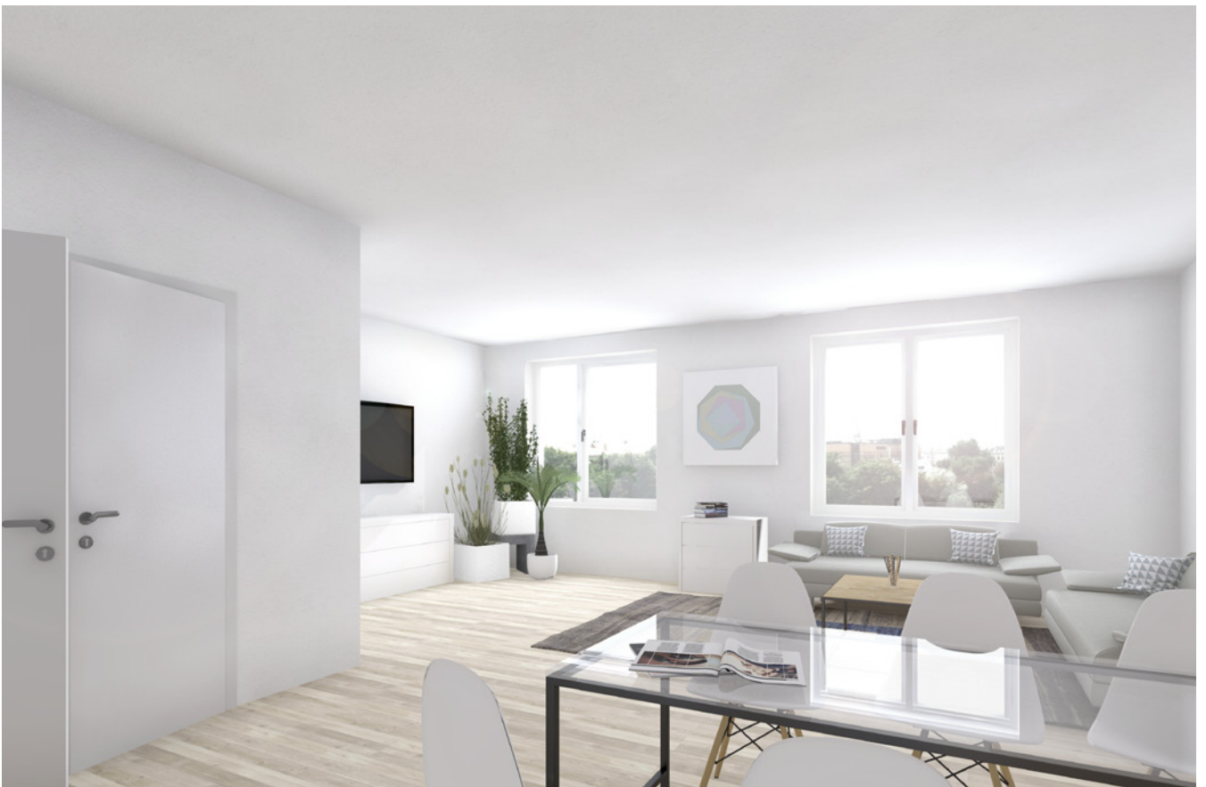
Ansicht Wohnungstyp 6